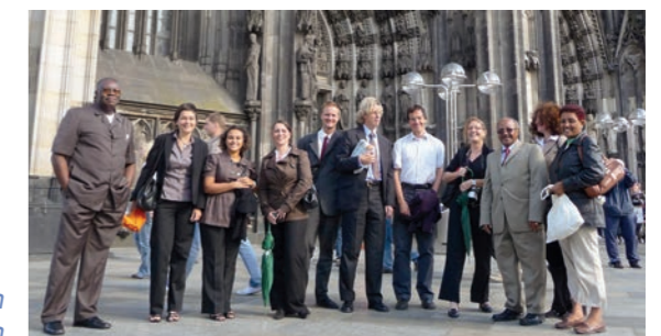
Repräsentanten-Ausflug zum Kölner Dom

Ausflug nach Köln im Rahmenprogramm zum 1. Repräsentanten-Workshop beim SES in Bonn mit Gästen aus Ägypten, Äthiopien, Ghana, Mosambik, Namibia, Sierra Leone und Syrien