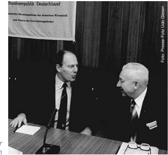
Bundesentwicklungsminister Dr. Jürgen Warnke (l.) im Gespräch

Gründung des Senior Experten Service (SES) beim Deutschen Industrie- und Handelstag (DIHT) in Bonn. Den Startschuss gibt Bundesentwicklungsminister Dr. Jürgen Warnke. Das Bundesministerium für wirtschaftliche Zusammenarbeit (BMZ) sagt finanzielle Unterstützung zu.