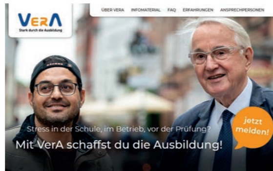
Startseite der VerA-Homepage

Die Initiative VerA geht mit einer neuen Homepage online.