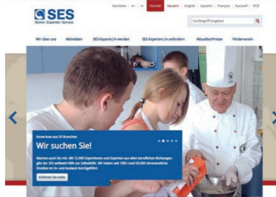
Startseite der SES-Homepage

03.06. Der SES geht mit einer neuen Homepage online.