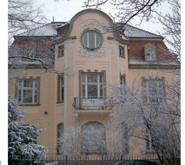
SES-Zentrale in Bonn

Das Haus Buschstraße 2 in Bonn wird erworben und Sitz der SES-Zentrale. Das Haus ist mit einer vernetzten EDV-Anlage ausgestattet.