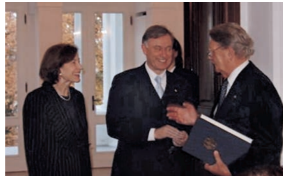
Eva Luise Köhler, Bundespräsident Prof. Dr. Horst Köhler und Dr. Rudolf Schuster

Bundespräsident Prof. Dr. Horst Köhler zeichnet Dr. Rudolf Schuster in der Villa Hammerschmidt in Bonn mit dem Bundesverdienstkreuz aus.