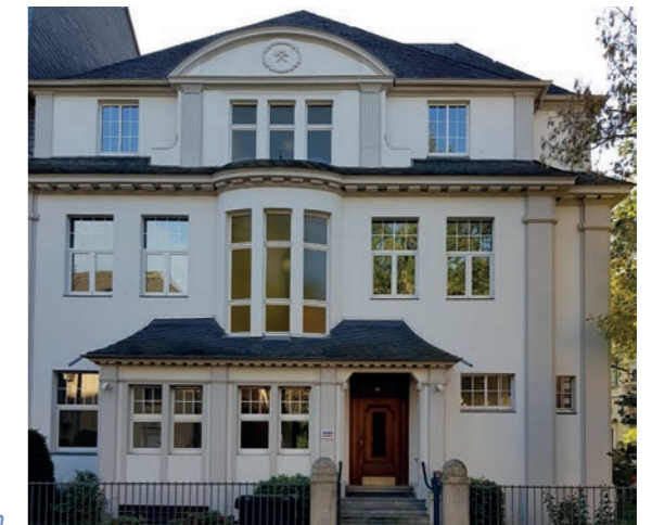
Schedestraße 11 in Bonn

Der SES erwirbt das Haus Schedestraße 11 in Bonn. Es wird an Verbände vermietet.