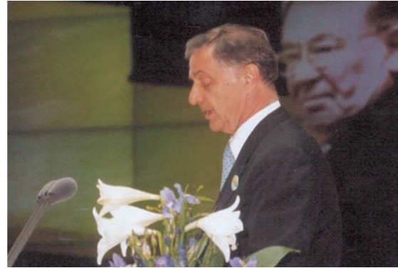
Dr. Franz Schoser

Festakt zum 20-jährigen Bestehen des SES im ehemaligen Plenarsaal des Deutschen Bundestages in Bonn