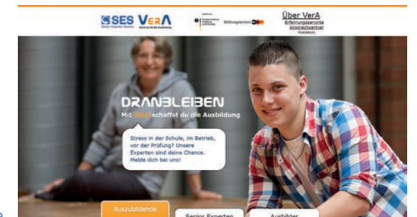
Startseite der VerA-Homepage

10.04. Die Initiative VerA geht mit einer eigenen Homepage online.