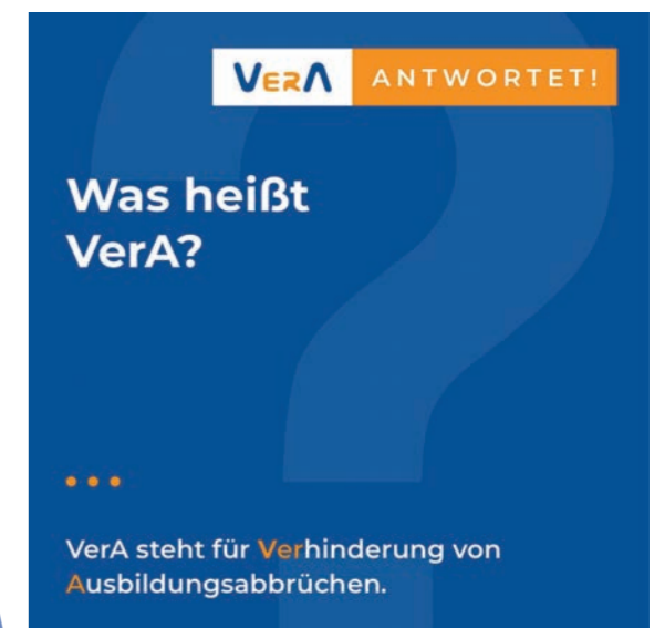
1. Instagram-Post der Initiative VerA

Die Initiative VerA postet erstmals bei Facebook und Instagram.