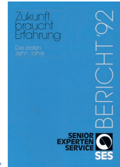
Titelseite SES-Jahresbericht 1992

Das Motto „Zukunft braucht Erfahrung“ erscheint erstmals auf dem Jahresbericht 1992.