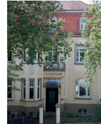
Buschstraße 2 in Bonn

Das Haus Buschstraße 2 in Bonn wird verkauft. Das Haus Schedestraße 11 in Bonn bleibt im Besitz des SES.