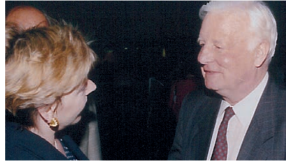
Bundespräsident Dr. Richard von Weizsäcker unter den Gästen der Jubiläumsveranstaltung

Festakt zum 10-jährigen Bestehen des SES in Anwesenheit von Bundespräsident Dr. Richard von Weizsäcker im Brückenforum Bonn-Beuel