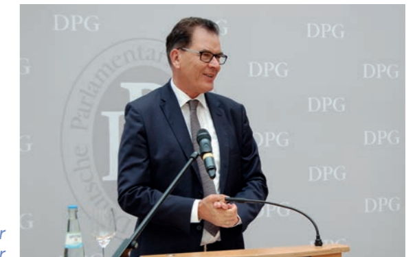
Bundentwicklungsminister Dr. Gerd Müller

26.06. Parlamentarischer Mittag in der Deutschen Parlamentarischen Gesellschaft in Berlin. Bundesentwicklungsminister Dr. Gerd Müller spricht das Grußwort.