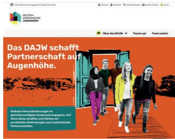
Startseite der DAJW-Homepage

Der SES ist Kooperationspartner im neuen Deutsch-Afrikanischen Jugendwerk (DAJW) und koordiniert die Programmlinie Team works! Mittelgeber ist das BMZ.