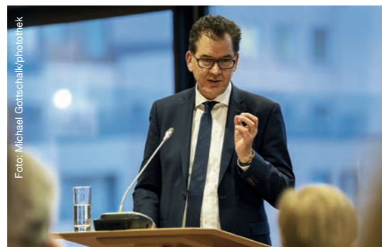
Bundentwicklungsminister Dr. Gerd Müller

26.01. Die SES-Juniorsparte Weltdienst 30+ läuft an. Die Kick-off-Veranstaltung findet beim BMZ in Berlin statt.